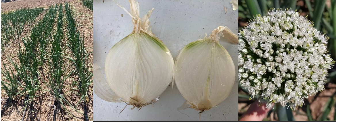
Shiro Soğan ( Allium cepa L.)