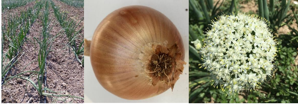
Bolton Soğan ( Allium cepa L.)