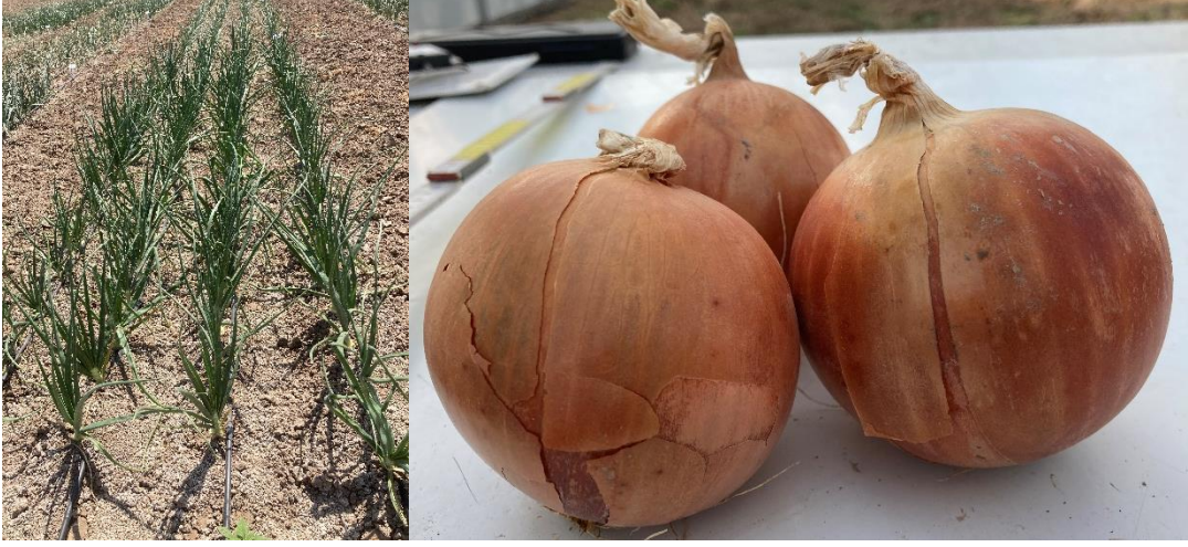
Recor Soğan ( Allium cepa L.)