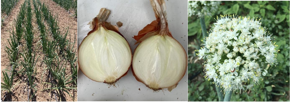
Sude Soğan ( Allium cepa L.)