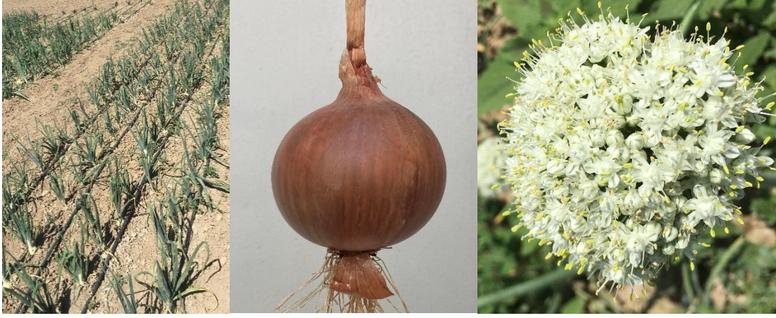
Şahmeran Soğan ( Allium cepa L.)