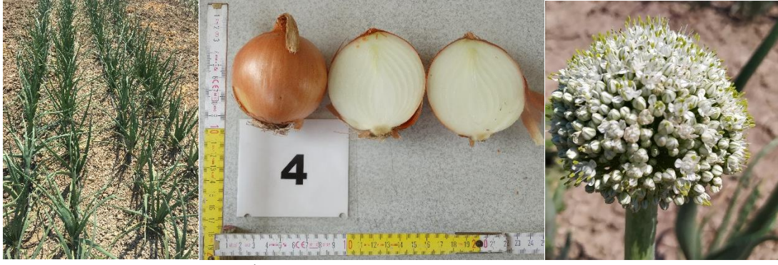
Olorosso Soğan ( Allium cepa L.)