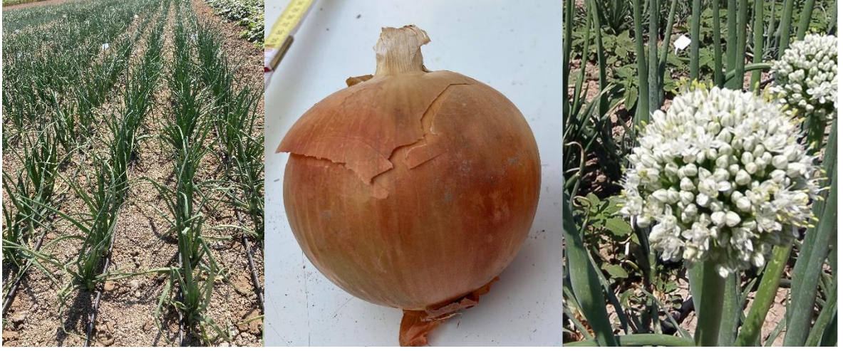
Kiler Soğan ( Allium cepa L.)