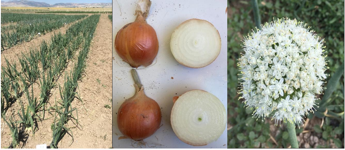
Carizma Soğan ( Allium cepa L.)