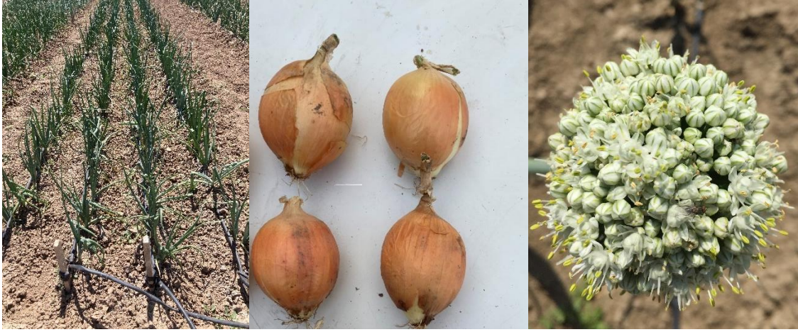
Öztan Soğan ( Allium cepa L.)