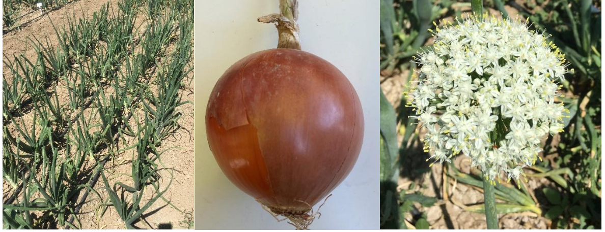
Hektor Soğan ( Allium cepa L.)