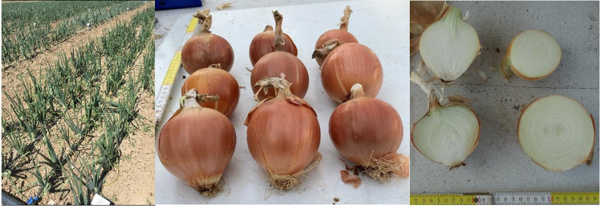
Class Soğan ( Allium cepa L.)