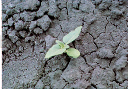
Şekil 1. Ayçiçeği V-2 (2-4 yapraklı dönem) gelişme dönemi

Denemesi yapılan bitki gelişim düzenleyicisinin tohum uygulamalarında çıkışın değerlendirilmesi parseldeki bitki sayısına göre ayçiçeğinin Şekil 1' de verilen 2-4 yapraklı döneminde (V-2 dönemi) yapılır. Denemede bu talimatta belirtilen ekim sıklığına göre olması gereken bitki sayısına, parselde sayılan bitki sayısı oranlanarak çıkış oranı belirlenir.