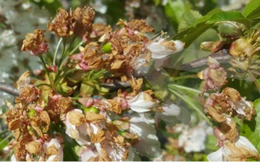
Şekil 1 c. BBCH 69 (Dr. H.Cumhur SARISU)