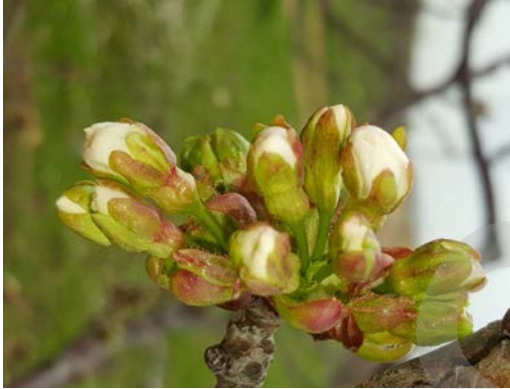
Şekil 1 a. BBCH 59 (Dr. H.Cumhur SARISU)

f) Meyve kalitesinin de etkilendiği düşünülüyorsa 3.2.4-d'de belirtilen meyve kalite özelliklerine ait ölçümler yapılmalıdır.