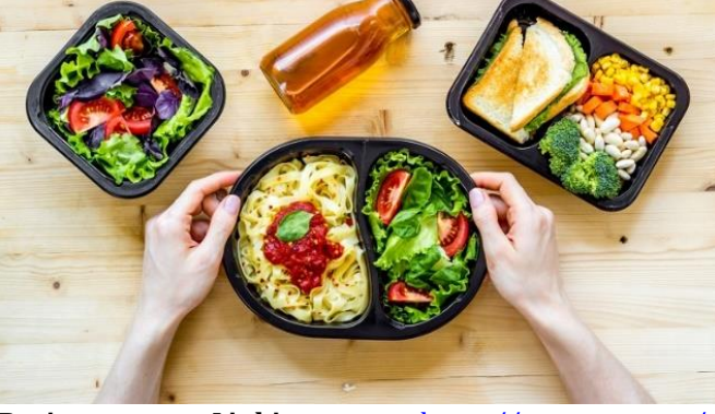
Resim Linki: https://www.sgs.com/-/media/sgscorp/images/corporate/news-body-images/2021-q4-cc-plastics-container.cdn.en.1.jpg

Yürürlüğe girdiği tarihte Yönetmelik aşağıdaki etkilere sahip olacaktır: