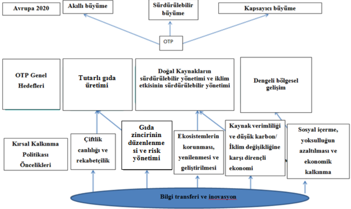
Şekil 4. 2014-2020 Kırsal Kalkınma: Kırsal Kalkınma Politikasına Yönelik Mantıksal Çerçeve

Kaynak: (Avrupa Komisyonu Tarım ve Kırsal Kalkınma Genel Müdürlüğü, 2013)