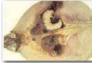
Testereliarı larvası ve zararı