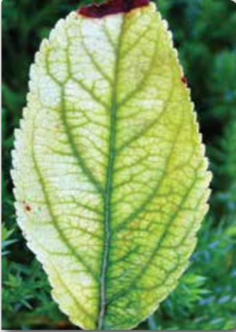
Yaprak damarlarının yeşil olması

bulunmaması durumlarında yukarıda sayılan belirtiler görülür.