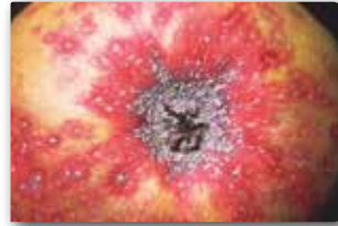
San Jose kabuklubiti zararı