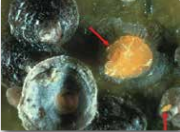
San Jose kabuklubiti ergini