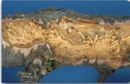
Meyve yazıcıböceği ergini ve zararı