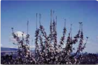
Ağacın genel görünümü