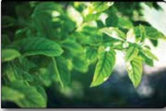
Yapraklardaki genel görünüm