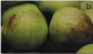
Elmanın kabuklarında oluşturduğu belirtiler