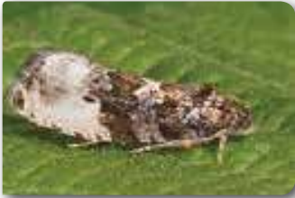
Yaprak yeşiltırtılı ergini