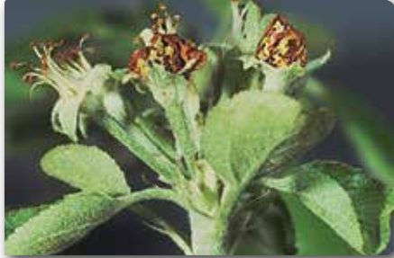
Meyve gözkurdu larvalarını zarar yaptığı çiçekler.

bir miktar arı kaybı da göze alınarak, uygun bir ilaç kullanılarak kimyasal mücadele yapılabilir. Mücadeleye karar verebilmek için, Baklazını erginlerinin ve zararının görülmesi gerekir. Bu nedenle, ağaçların pembe tomurcuklarının görüldüğü zamandan itibaren, erginlerin çıkışı gözlenmelidir. Ergin böcekler topraktan çıkıp, çiçeklerle beslenmeye başladığı zaman bir ilaçlama yapılmalıdır.