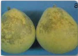
Armutta Hasat sonrası depo yanıklığı