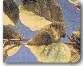
Virusun yapraktaki belirtileri