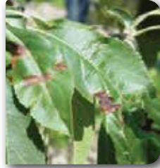
Elmada çürüklüğe neden olan etmenin yapraktaki belirtileri