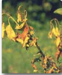
Elma süğününde renk değişimi