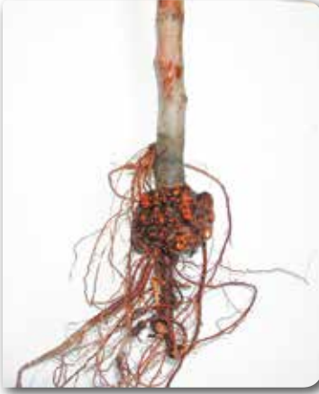
Kök boğazında ur