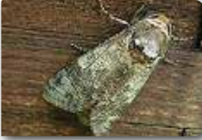
Ağaç kızılkurdu ergini