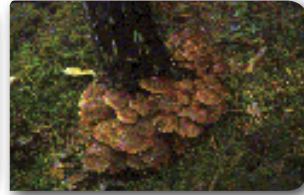
Hastalığın ağaç kökündeki görünümü ve mantarın şapkalı dönemi.