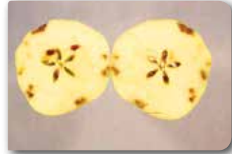
Alternarya meyve çürüklüğünün elma meyvelerindeki belirtileri.