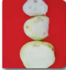
Acı benek hastalığının elma meyvesindeki belirtisi.