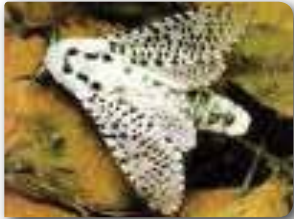
Ağaç sarıkurdu ergini