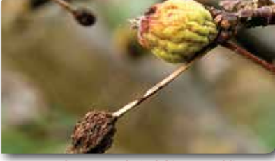
Elma meyvelerindeki zarar şekli.