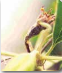
Elma çiçeğinde krem rengi sütümsü akıntı ve renk değişikliği