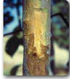
Gövdede renk değişikliği