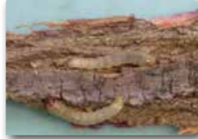
Ağaç kızılkurdu tırtılı ve zararı