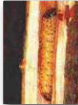
Larvası ve zararı