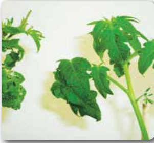
PSTVd'nin domateste oluşturduğu şekil bozukluğu

( Potato spindle tuber poospiviroid (PSTVd) )