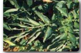
Yapraklarda yukarı doğru kıvrılmalar