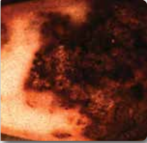
Patates çürüklük nematodu'nun yumrudaki zararı.

Nematodların küçük mikroskopik canlılar olması ve bitki paraziti nematod türlerinin birbirlerine çok benzemesinden dolayı (özellikle Patates çürüklük nematodu ile Soğan-sak nematodu aynı grupta yer almaktadır ve bu gruba ait nematodların teşhisi oldukça zordur) kesin teşhis yapıldıktan sonra karar verilmesi önemlidir.