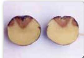
Yumurta içinde sulu yumuşak çürüme