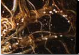
Patates kist nematodlarının kök üzerindeki görünüşü