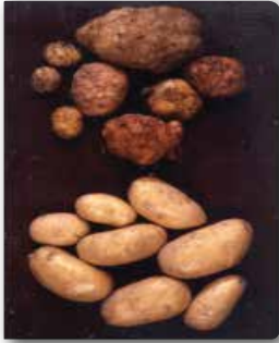
Kök-ur nematodunun yumrudaki zararı