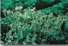
Hastalığın tipik belirtisi