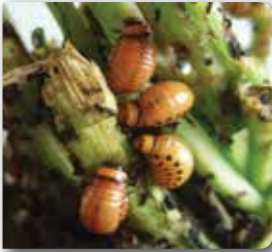
Patates böceği larvaları