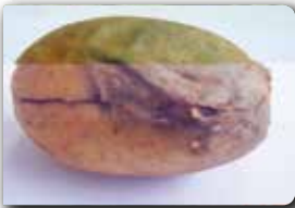
Yumru kabuğundaki belirti