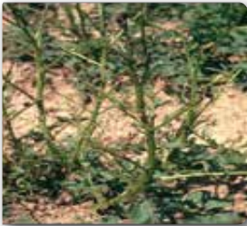
Yumurtadan yeni çıkan larvalar

• Patates böceği Marmara Bölgesi koşullarında 3-4, Orta Anadolu Bölgesi koşullarında 1..5 döl vermektedir.