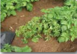
Gelişmede durgunluk, bodurlaşma ve solgunluk

( E. carotovora subsp. atroseptica ) ( E. chrysanthemi )