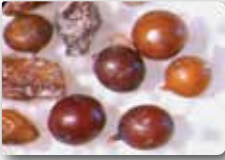
Patates kist nematodlarının mikroskop altındaki görünüşü

(PATATES ALTIN NEMATODU; Globodera rostochiensis Wollenweber ve PATATES BEYAZ KİST NEMATODU; G. pallida Stone)