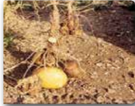
Kök boğazında ur oluşumu