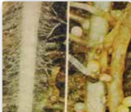
Patates kist nematoduyla enfekteli (sağda) ve (solda) patates kökü