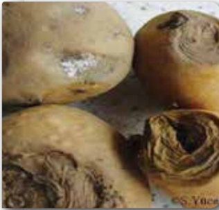
Yumruda koyu renkli çökük yüzeysel