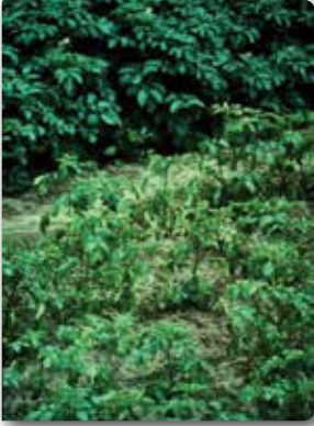
Patates bitkisinin, Patates kist nematoduyla enfekteli (alt) ve ilaçlı (üst) alandaki üst aksam görüntüsü