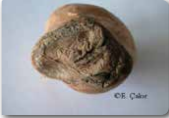
Yumruda Fusarium spp.'nin neden olduğu çürüklük ve buruşma belirtisi