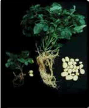
Patates kist nematodunun Bitki ve yumru verimine etkisi (Sağ: temiz- Sol:enfekteli)

yetiştirilmemesi halinde popülasyonu her sene % 30-33 oranında azalır.