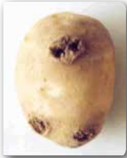
Çukur uyuz lekeleri