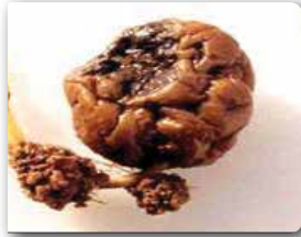
Stolonda ur oluşumu