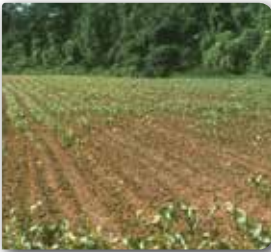
Telkurdu'nun tarladaki zararı