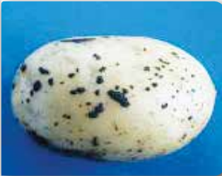
Yumru üzerindeki siyah siğil belirtileri