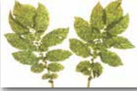
Yapraklardaki mozaik ve beneklenme