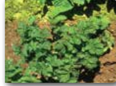
Patates yapraklarındaki mozaik ve deformasyon belirtileri

ileri safhalarında tepe yapraklarında kıvrıklaşma oluşur. Yaprak kırçillı olur, dokunulduğunda kolaylıkla sapa bağlı yerden kopar. Alt yapraklar ise, nekrotikleşip gövdeye yapışır. Büyümede gerileme olduğu gibi, yumru bağlama da azalmaktadır.