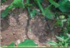
Karabacak veya dip yanıklığı belirtisi