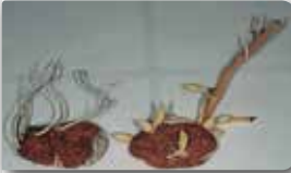
Solda hastalıklı yumrunun iplik şeklinde çimlenmesi, sağda sağlam yumru