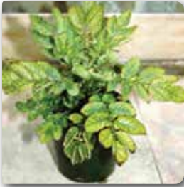
PSTVd'nin patateste neden olduğu gelişme geriliği ve dikine büyüme