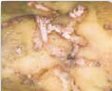
Patates güvesi zararı