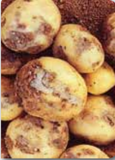
Gözlerden çıkan bakteriyel akıntı