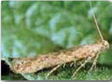
Patates güvesi ergini