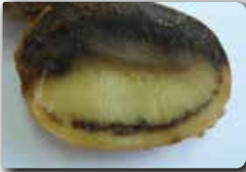
İletim demetlerinde renk değişikliği