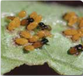
Yumurtadan yeni çıkan larvalar