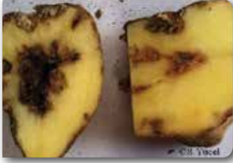
Yumru etinde kahverengi nekrotik alanlar lekeler