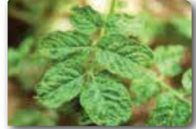
Mozaik ve deformasyon