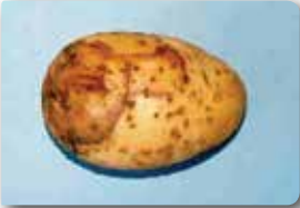
Yumuşak çürüklüğün kabuktaki ilk belirtileri