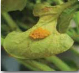
Patates böceği yumurtaları