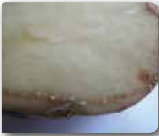
İletim demetlerinde bakteriyel akıntı