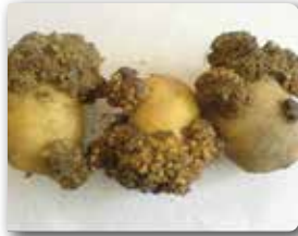
Yumruda ur oluşumu