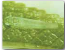
Yaprak piresi ergini