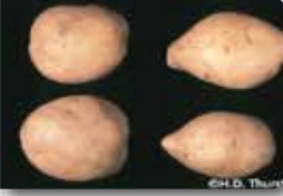
PSTVd'nin yumrularda neden olduğu iğ şeklinde uzama