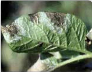
Yaprakda lekelerin alt yüzeyindeki beyaz mantar tabakası