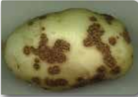
Kabarık uyuz lekeleri