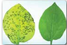
Yapraklardaki beneklemeler (Sağda sağlıklı yaprak)

Konukçuları : Tütün, domates, biber ve patates