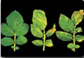
Yapraklarda oluşan belirtiler

( Clavibacter michiganensis subsp. sepedonicus )