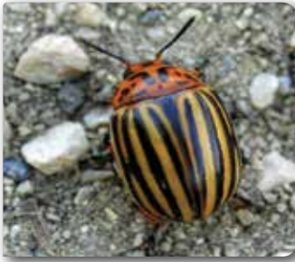
Patates böceği ergini