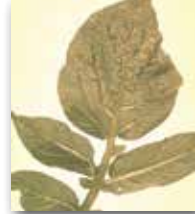
Yaprak alt damarlarındaki nekrotik leke ve çizgiler

Konukçuları : Tütün, domates, biber ve patates