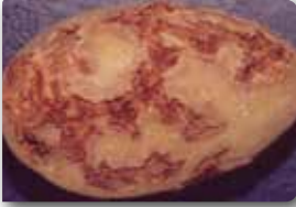
Yüzeysel uyuz lekeleri