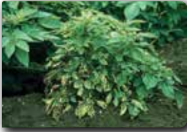
Alt yapraklardan başlayan solgunluk