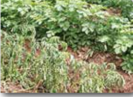
Yeşil aksamda solgunluk