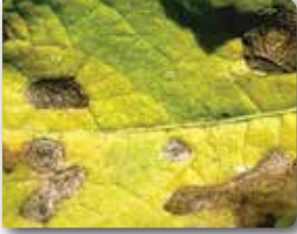
Yapraktaki iç içe halka şeklindeki belirtiler.