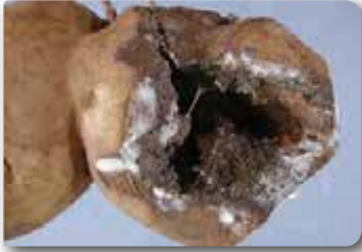
Yumruda oluşan boşluk ve üzerinde gelişen fungus

• Nemli ortamda yumuşak çürüklük bakterileri tarafından meydana getirilen sekonder enfeksiyonlarda gelişebilir. Uzun depolanma süresi sonunda hastalık ilerledikçe yumru da tamamen çürüme, buruşma ve mumyalaşma görülür.