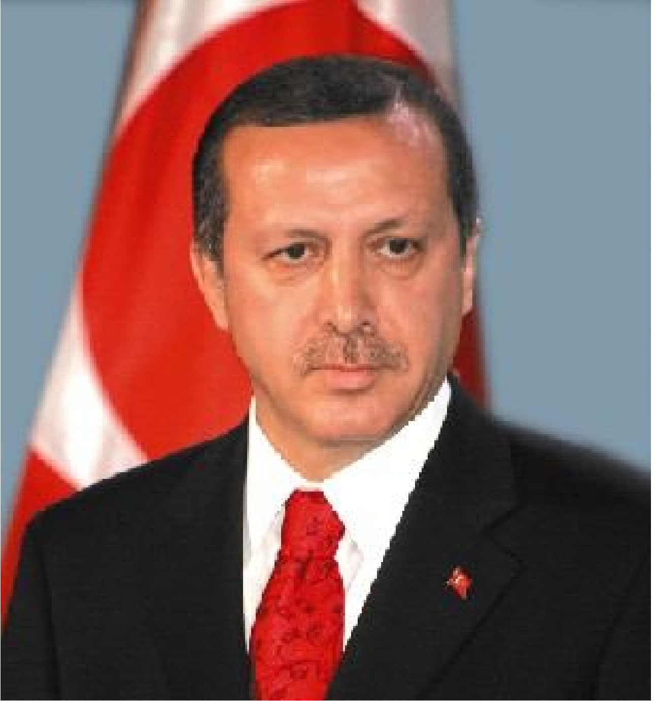
Recep Tayyip ERDOĞAN Başbakan