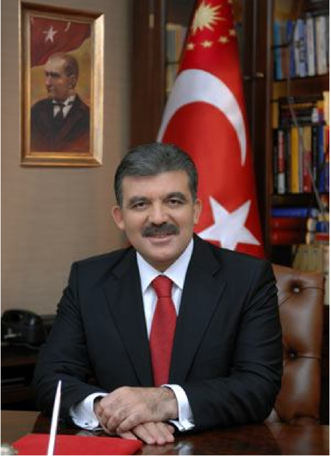
Abdullah GÜL Cumhurbaşkanı