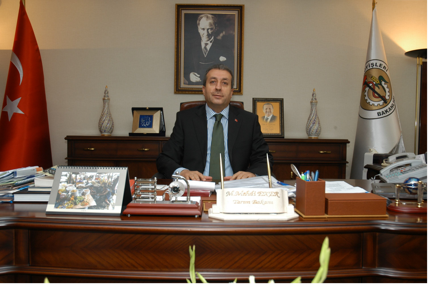
Mehmet Mehdi EKER Tarım ve Köyişleri Bakanı