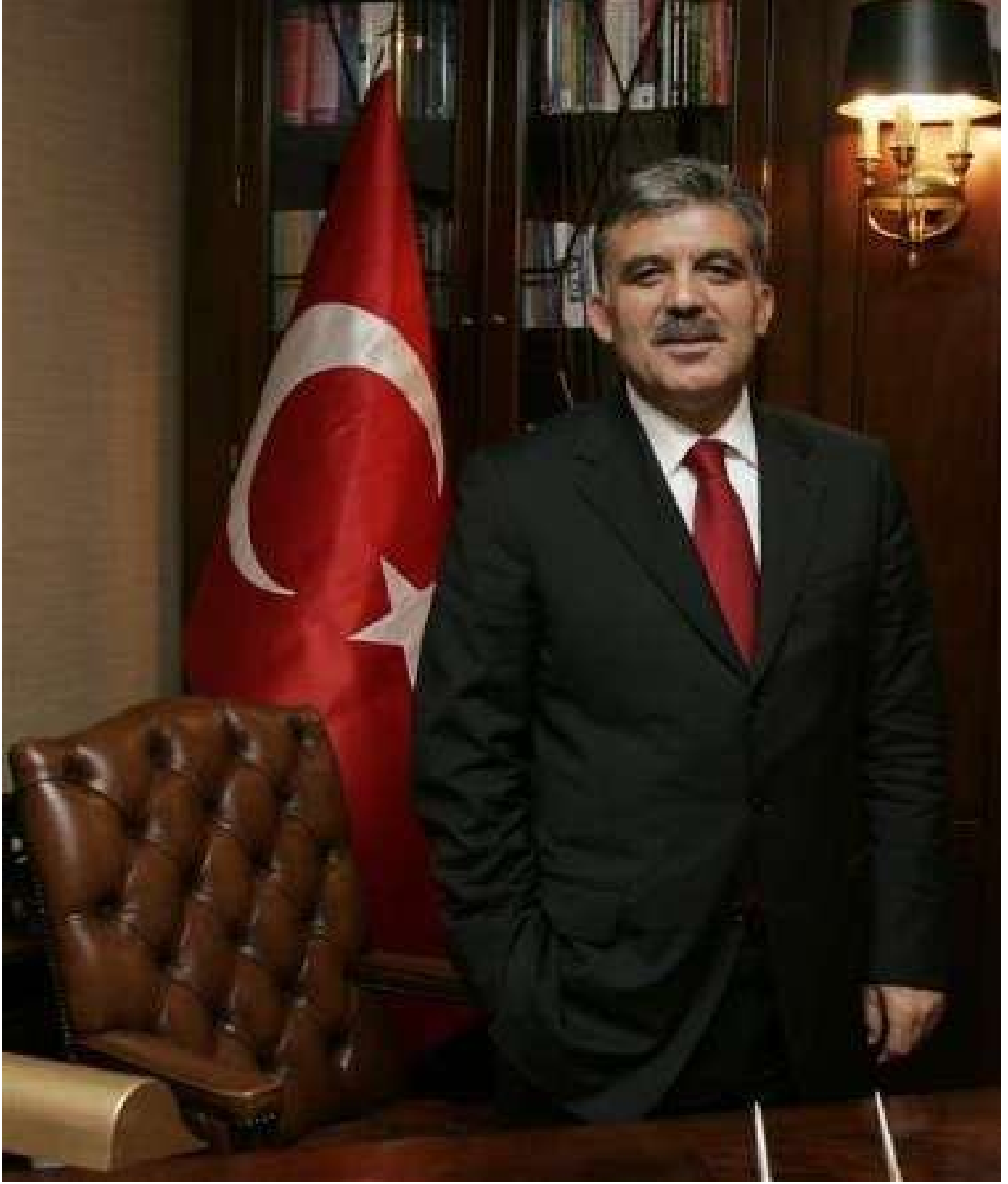
Abdullah GÜL Cumhurbaşkanı