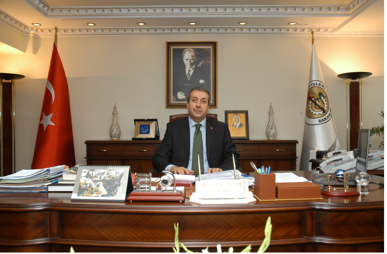
Mehmet Mehdi EKER Tarım ve Köyişleri Bakanı