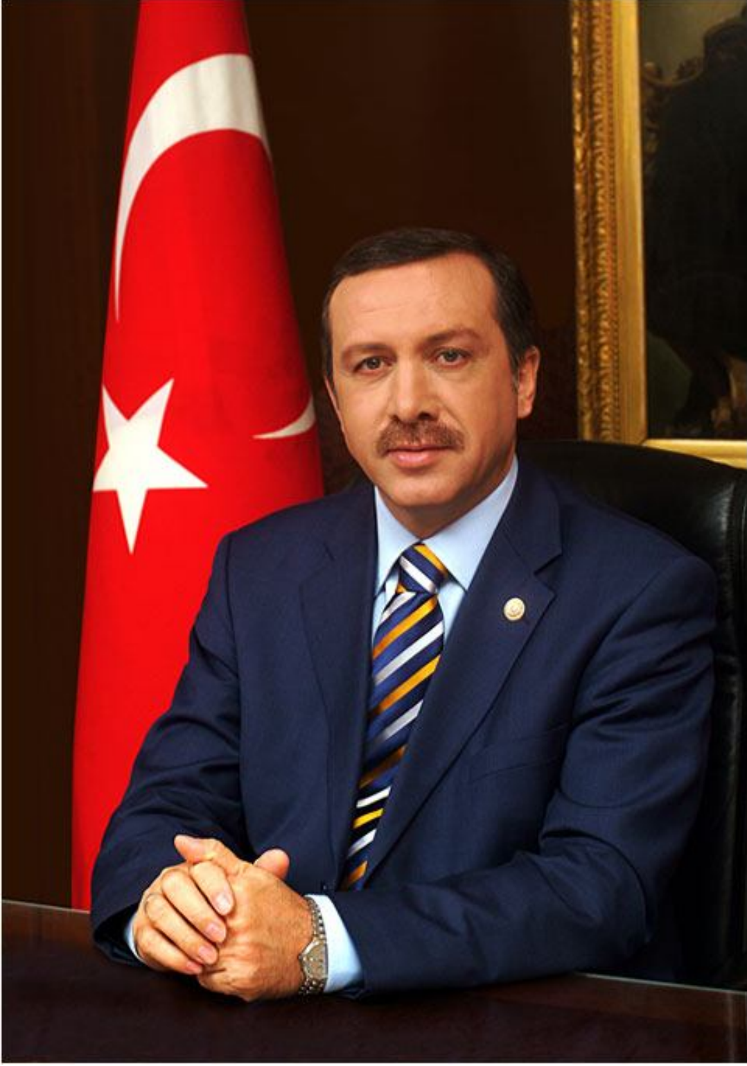
Recep Tayyip ERDOĞAN Başbakan