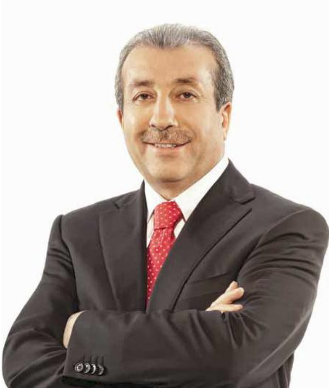
Mehmet Mehdi EKER Gıda Tarım ve Hayvancılık Bakanı