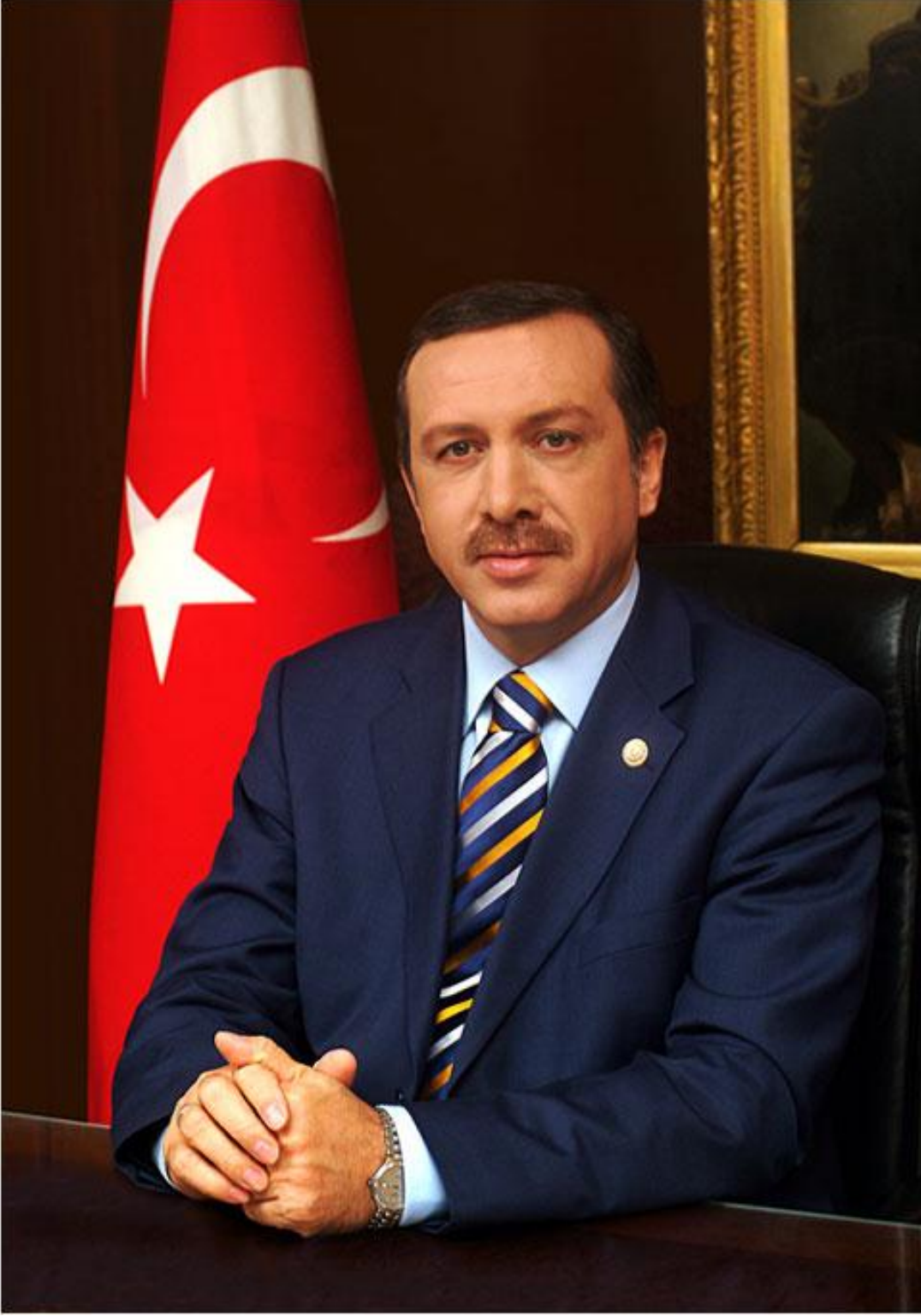
Recep Tayyip ERDOĞAN Başbakan