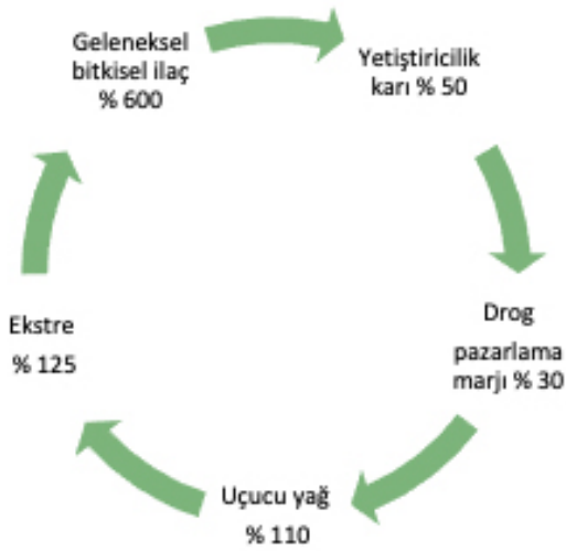
Şekil 2. Tıbbi Nane Katma Değer Döngüsü

Perakendeciler (Eczaneler, herbalistler, sağlık malzemeleri satan yerler, kozmetik ve parfümeri endüstrisi, niş perakende, farmasotik endüstrisi),